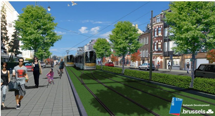
Zicht van het deel van de De Smet de Naeyerlaan tussen de Charles Woestelaan en de Jules Lahayestraat. De grasbezaaiing en de bomenrij versterken het structurerende karakter van de laan.