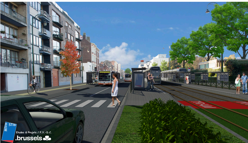
De eigen bedding van de tram zal niet langer in het midden van de laan liggen maar verplaatst worden naar het westen, langs het kerkhof van Jette en het Jeugdпарк.